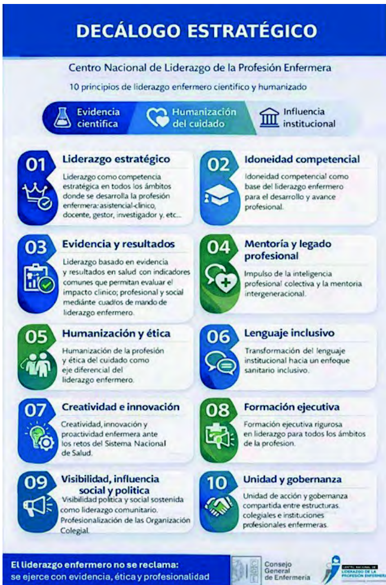
Figura 1.4. Decálogo del CNLPE.