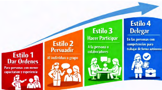
Figura 1.1. Progresión de los estilos de liderazgo.

La teoría del liderazgo situacional fue planteada por Hersey y Blanchard en 1984, basada en la idea de que el estilo de liderazgo más eficaz es aquel que mejor se adapte a los colaboradores en cada situación. Los comportamientos de un líder caracterizan a los cuatro estilos básicos de dirección, teniendo en cuenta el mayor o menor énfasis que debe poner en dos variables: conducta de tarea y conducta de relación, para ser congruente con el nivel de madurez del colaborador tanto a nivel de conocimientos y técnico como a nivel de madurez emocional. Los estilos de liderazgo en este modelo son: el Estilo 1, dar órdenes para personas con menor capacitación y experiencia; Estilo 2, persuadir al individuo o grupo; Estilo 3, hacer participar a la persona o colaboradores; y el Estilo 4, delegar en las personas que ya tienen competencias para desarrollar de forma autónoma lo que se encomienda, siendo clave la flexibilidad en modular el estilo de liderazgo y adaptarse en función de la persona, situación y contexto (13).