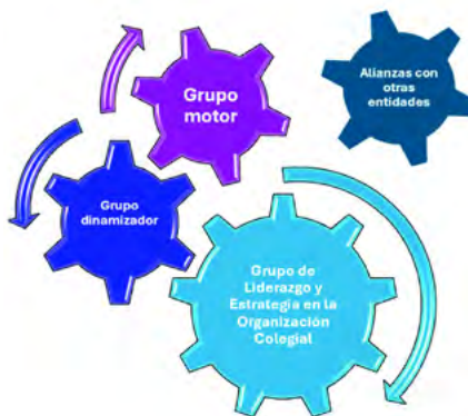
Figura 1.3. Grupos del CNLPE.

Para ello se han puesto en marcha tres grupos de profesionales enfermeras y enfermeros con distintos perfiles para recoger todos los puntos de vistas y enfoques de la profesión. Estos grupos son: el grupo motor, el grupo de la organización colegial y el grupo dinamizador. Están conformados con personas representantes de la organización colegial, clínico asistencial, ámbito gestor, docente, investigador, sociosanitario, político, asociacionismo profesional, ejercicio libre de la profesión y de la comunicación, divulgación y redes sociales.